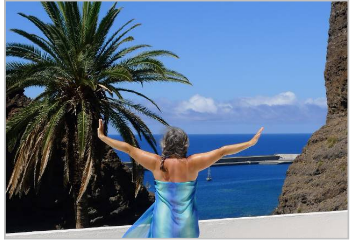
Foto 2015 La Gomera